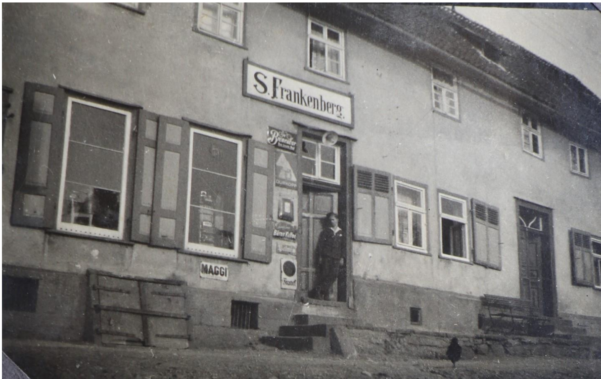
Wohn- und Geschäftshaus der Familie Frankenberg, Haus Nr. 112, heute: An der Nebelbecke 17. Aufnahme aus dem Jahr 1931.