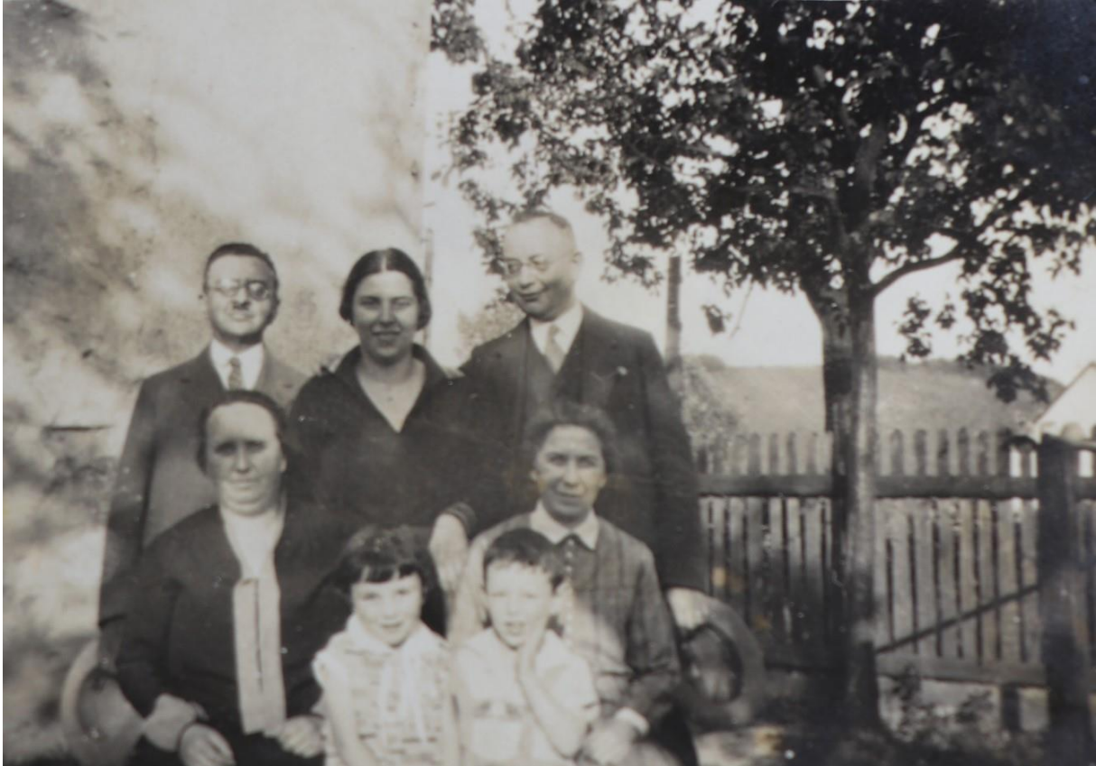
Die Familie Frankenberg aus Meimbressen Anfang der 1930er Jahre