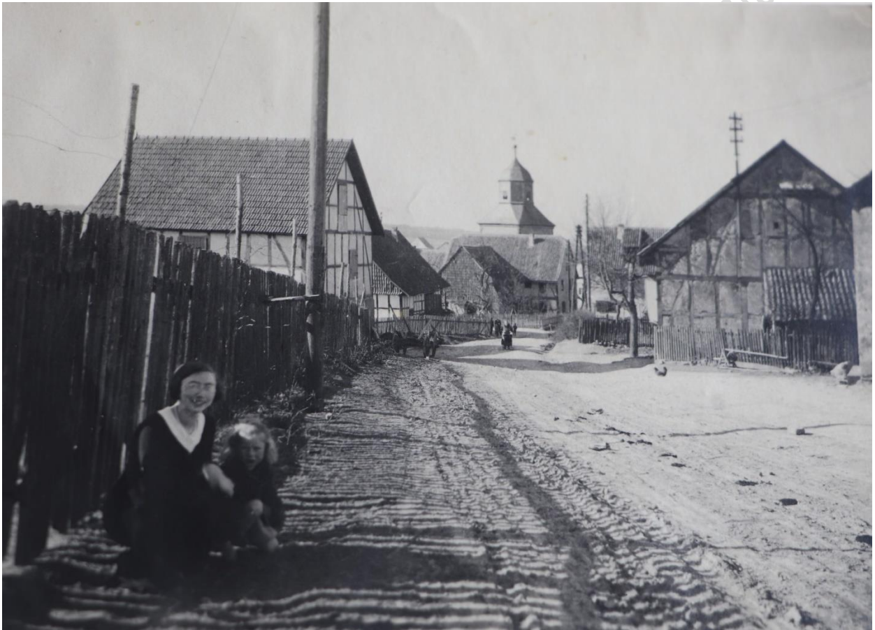
Meimbresser Dorfansicht ca. 1932

ihre deutsch-jüdischen Wurzeln in Nordhessen blickt: „(...) It was very emotional for me, as a German citizen, to visit Meimbressen for the first time with my son (...) we got an idea of the beautiful place my family belongs to. Certainly mixed feelings came up, but we are the post-war generation and need to share our past feelings in a different way: never to forget and create new fresh bondings among people with whom our roots belong together. “ 77